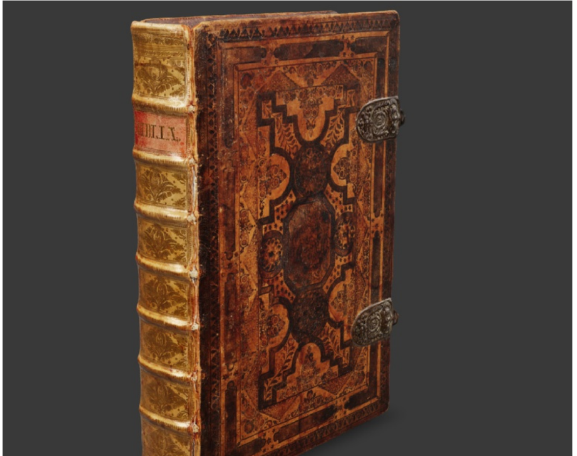
DIGITAL KUNST: Denne Bibelen er det tatt mellom fem og sju tusen bilde av, for å få ei unik tredimensjonal djupn.

I same prosessen kom han på ideen om å lage kryptokunst av biblar. Han kjente ikkje til andre museum som laga tredimensjonal digital kunst, men tenkte det-