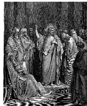
Figur 1 Kristus i Synagogen av Gustav Dore

Vi vil også i denne serien bestående av fire deler om synagogen se nærmere på dens arkitektur, hvordan den ble finansiert, hva synagogen ble brukt til. Avslutningsvis skal vi sammenligne synagogen med den første kristne menighet.