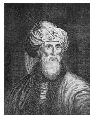
Figur 2 Flavius Josefus

Det meste man vet om synagoger er hentet fra skrifter av den gresk-jødiske filosofen Filon fra Alexandria som levde ca. år 20 f.Kr. – 50 e.Kr., den jødiske historieskriveren Flavius Josefus som levde år 37 f.Kr. – ca 100 e.Kr., Misjná , en samling kommentarer basert på jødernes muntlige lov som dateres til slutten av det 2.- og begynnelsen på det 3. årh. e.Kr. og Talmud som beskrives som en kommentar til Misjná , som ble samlet og utarbeidet fra det 2. årh. e.Kr og fram til middelalderen. Det er også funnet noen inskripsjoner der synagoger nevnes og noen få ruiner av synagoger datert til den andre halvdel av det 1. årh. e.Kr. I tillegg til dette er det mye verdifull informasjon å hente ved å studere de over 70 gangene synagogen nevnes i NT, som en autoritet innen synagogeforskningen kalte et « uvurdelig material ». 1 La oss se på noen eksempler fra disse kildene, vi begynner med de ovennevnte skriftene.