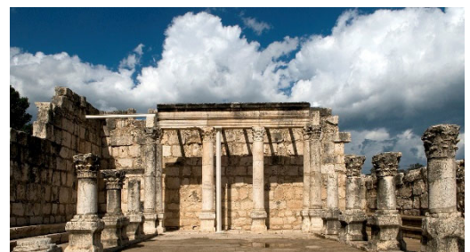
Figur 4 Ruiner av en synagoge i Kapernaum

Selv om det er finnes en hel del skriftlig materiale om synagoger er det meget få arkeologiske funn før det 2. årh. e.Kr. Grunnen til dette kan være flere. Det er vanskelig å se om et sted har vært en synagoge, noen synagoger har vært i private hjem. For eksempel sies det i Misjna: «Hvis jeg visste at det [et hus] skulle bli gjort om til en synagoge ...» (M Nedarim 9: 2H). En annen grunn er at mange synagoger ble totalt ødelagte av romerne under krigen med jødene i det 1. årh. e.Kr. Og flere steder er det blitt bygget moderne bygninger over som gjør det vanskelig å gjøre