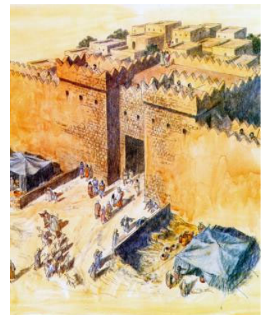
Figur 5 Illustrasjon av en byport i Israel

«Arkeologiske data bekrefter det faktum at den bibelske (d.v.s fra jernalderen) porten var stedet for mange offentlige virksomheter. ... rommene ... var åpnet ut mot hovedpassasjen og var enten to, fire eller seks i antall, og kunne noen ganger være av romslig størrelse (i ett tilfelle nådde de en lengde på 9 m). De inneholdt ofte benker og vannbassenger av stein. Disse