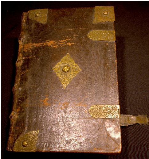
Thorlákurbibelen fra Island - datert til 1644