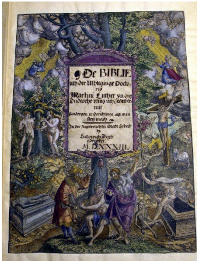
Flotte farger i den aller første Luther-bibelen fra 1533